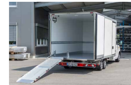
Transport, Logistik und vielem mehr.