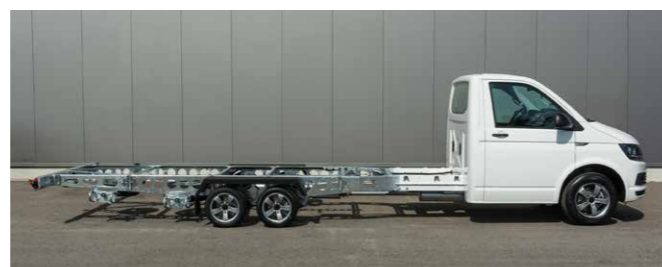
Beste Nutzlast: Aufbauten von bis zu 2,8 t sind mit den ALGEMA Chassis-Tec Fahrgestellen 13" möglich.