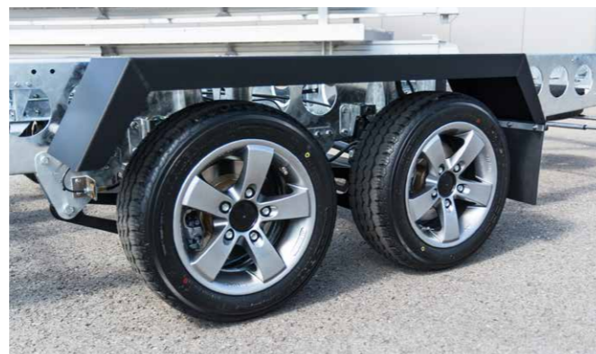
Höchster Fahrkomfort: Serienmäßig kompressor-gesteuerte Luftfederung der Hinterachsen und wartungsfreundliche Scheibenbremsen.