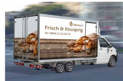
... Bäckereien oder Heim-Lieferdienste