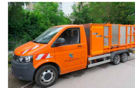
... Entsorgung im Kommunalbereich ...