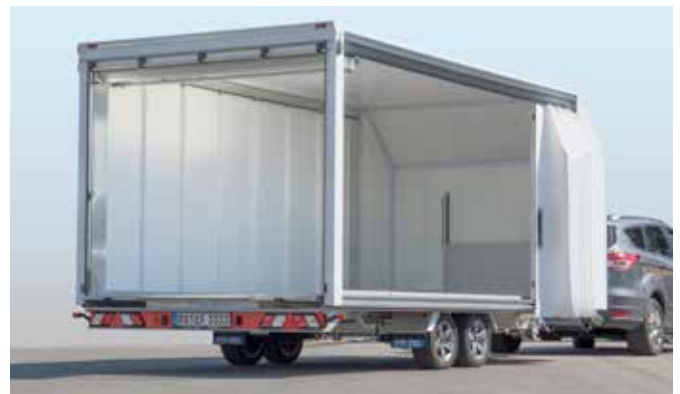
... mit den leichtgängigen Schienen schnell geöffnet.