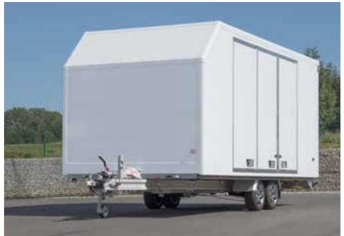
Kofferaufbau EURO-Van mit seitlicher 3-teiliger Tür, geschlossen, ...

Diebstahlgesichert durch abschließbare Türen/Klappen