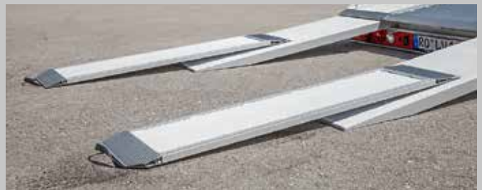
Verringern Sie für flache Sportwagen oder Fahrzeuge mit Spoiler den Auffahrwinkel mit zusätzlichen Ladeschienen.