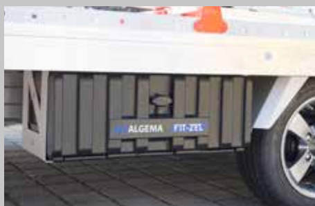
Werkzeugkästen aus Kunststoff bieten viel Stauraum für Werkzeug und Zubehör.