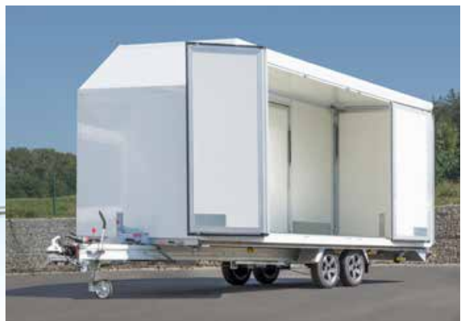
... geöffnet, für freien Zugang zur Ladung.