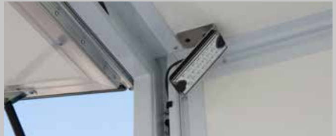
Innenbeleuchtung zum Be- und Entladen bei Dunkelheit, hinten links und rechts angebracht.