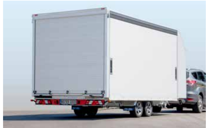
Kofferaufbau EURO-City mit seitlicher Schiebeplane, geschlossen, ...

Farbe: MB 9147 Arktikweiß, pulverbeschichtet