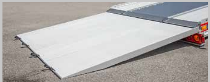
Wertvolle Güter flexibel aufladen mit den optionalen Plateau-Ladeschienen.