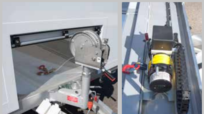
Schnell und problemlos beladen Sie nicht rollfähige Fahrzeuge mit Hand- oder Elektroseilwinden – auf Windenschiene, stufenlos verstellbar.