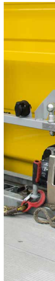
Die Seilwinde mit Kunststoffseil – gesteuert von der Funkfernbedienung – hilft beim Auffahren defekter Fahrzeuge.